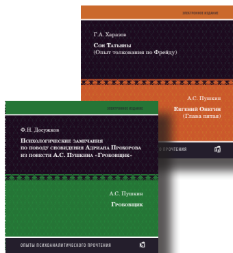
ISBN 978-5-98904-208-1 31 с., e-book

Такое двойное издание — психоаналитического исследования и исследуемого произведения — дает возможность установить мосты между различными, как бы это странно ни звучало, сферами психологического знания — наукой и искусством, психоанализом и психологией, между индивидуальной и культурной историей. Психоаналитическая работа предоставляет в наше распоряжение опыт, способ и тактику чтения и понимания. А обращение к исследуемому произведению погружает в авторский дискурс, являя эмпирику психологического мышления.