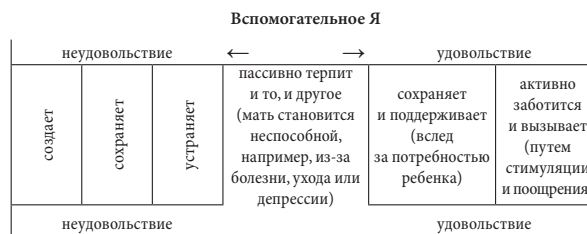
Диаграмма иллюстрирует диапазон возможностей при диспозиции вспомогательного Я для влияния на баланс удовольствия—неудовольствия у младенца.

Данная диаграмма не является рейтинговой шкалой, и пространство, отведенное различным секциям, не отражает соответствующее им значение.