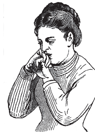
Рис. 4. 11-летняя сосательница тыльной стороны ладони, дочь хирурга

Гор — большой палец, причем обычно правой руки, реже два или три пальца одной и той же руки, а именно указательный и средний палец, иногда указательный и безымянный палец, или три средних пальца, а реже всего большой палец ноги. Последние в этом союзе — те, кто посасывает тыльную сторону ладони или предплечье. Таким образом, мы имеем сосателей пальцев или одного большого пальца, сосателей тыльной стороны ладони и сосателей предплечья (рис. 3—5 1 ).