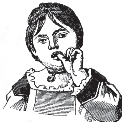
Рис. 3. 8-летняя сосательница большого пальца, дочь ювелира

При пустом рте сосут либо с сомкнутыми губами, при этом кончик языка касается то нижней, то верхней губы, либо кончик языка отчетливо виден между губами. Первую категорию мы назовем сосателями губ, вторую — сосателями языка (рис. 1 и 2).